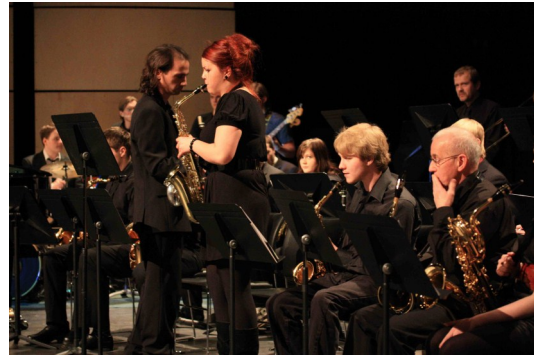
Mynd frá jólatónleikum Stórsveitar Tónlistarskólans sl. laugardag í Hofi.

Jólatónleikar strengjasveitanna verða miðvikudaginn 7. desember kl. 17:00 og kl. 19:00 sama dag er píanódeildin með tónleika. Þann 14. desember eru tvennir tónleikar, kl. 18:00 eru jólatónleikar blásarasveitanna og kl. 20:00 eru blandaðir jólatónleikar, má segja að þeir tónleikar séu þverskurður frá deildum skólans. Við endum svo tónleikadagskrána fyrir jól með slagverkstónleikum þann 19. desember kl. 18:00 og söngdeildin syngur okkur síðan inn í jólin þriðjudagskvöldið 20. desember kl. 20:00. Allir tónleikarnir verða í Hömrum í Hofi og hvetjum við Akureyringa til að koma og njóta aðventunnar með nemendum TA.