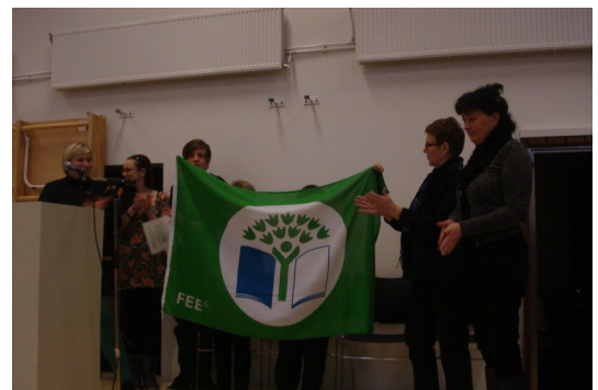
Næsti Skóla-akur kemur út fimmtudaginn 17. desember 2011

Í lok október fóru nemendur miðeildar ásamt tveimur nemendum elstu deildar og kennurum til Færeyja að heimsækja skóla í Kvívík. En samstarf hefur verið á milli skólanna í eitt ár. Hópurinn dvaldi í fimm daga við leik og störf og munu Færeyingarnir koma í heimsókn til Hriseyjarskóla í vor.