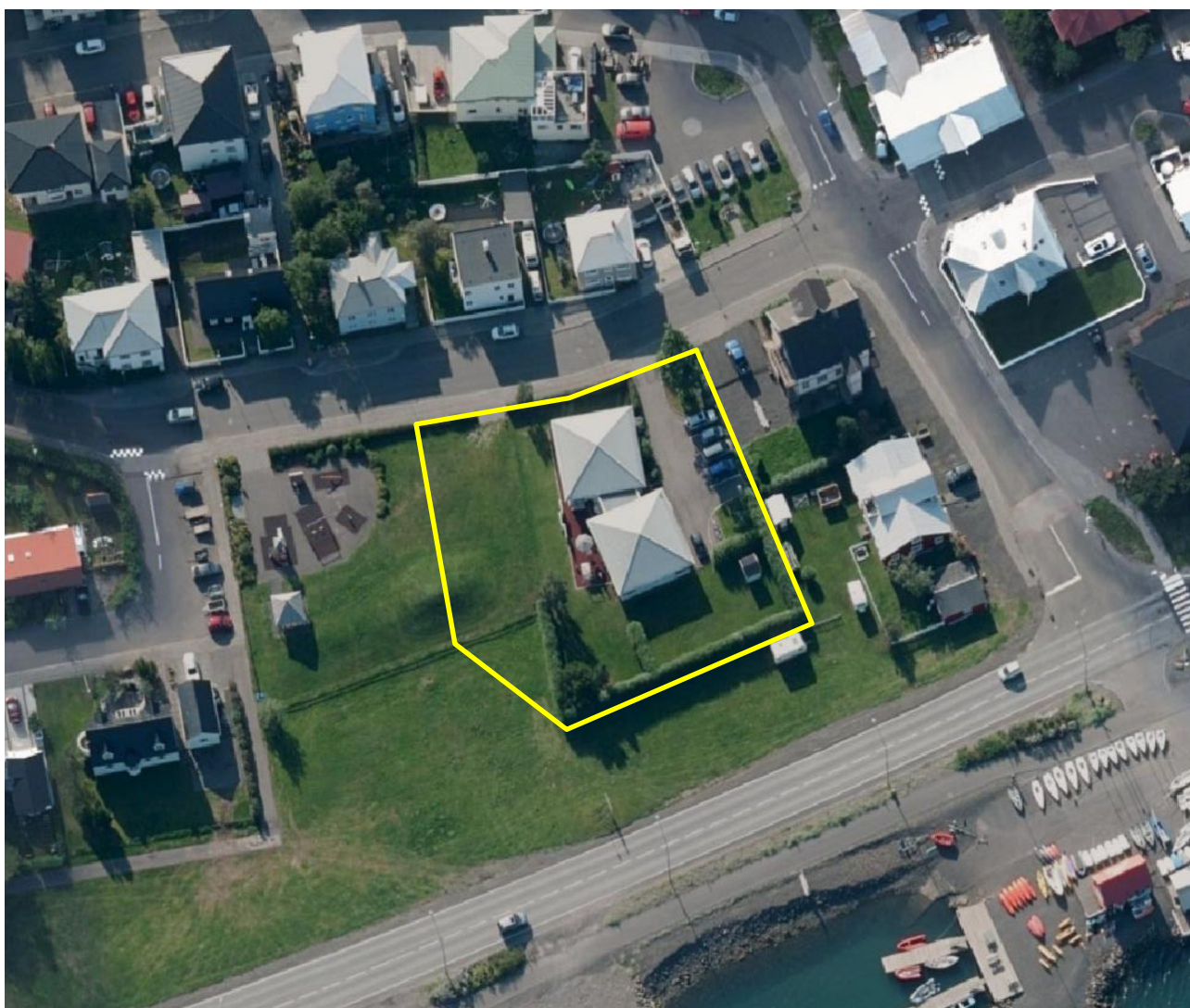
Mynd 1. Loftmynd sem sýnir staðhætti, gul útlína sýnir afmörkun þess svæði sem breytingin nær til.

Skv. skipulagslögum nr. 123/2010 skal við upphaf vinnu við gerð skipulagsáætlunar, aðalskipulagsbreytingar í þessu tilfalli, taka saman lýsingu á skipulagsverkefninu þar sem m.a. er skýrt hvernig staðið verði að skipulagsgerðinni.