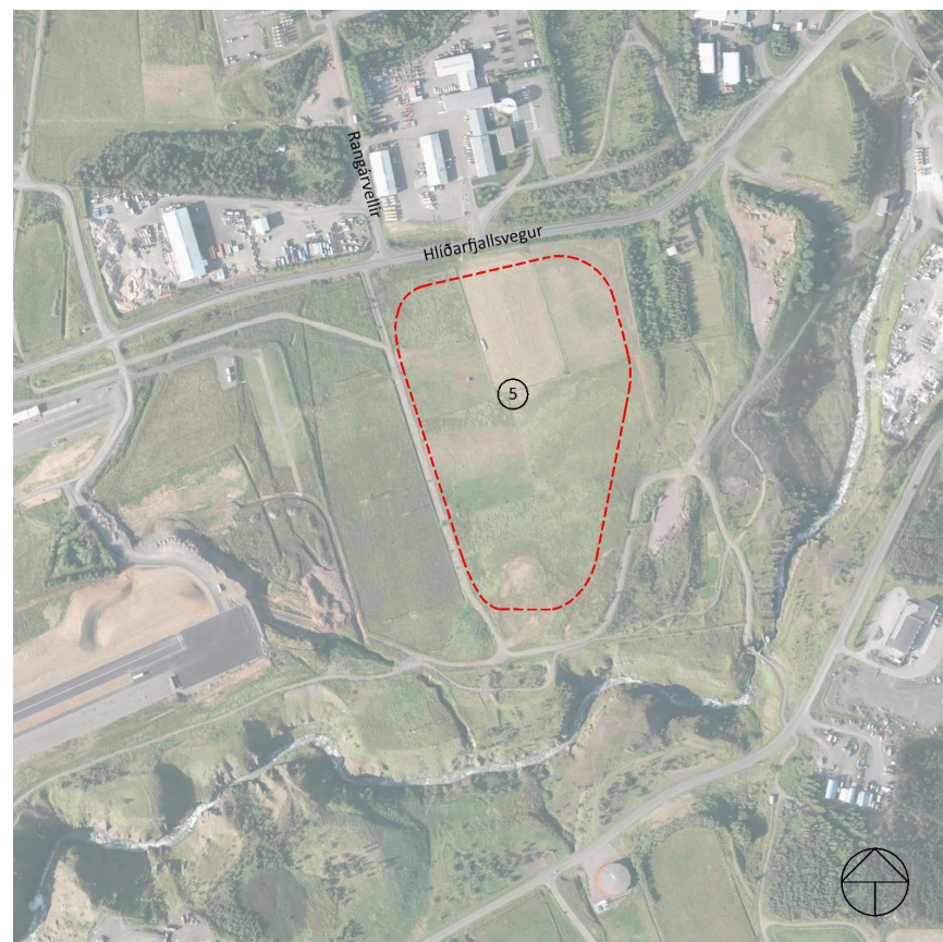
Mynd 3 Fyrirhugað skipulagssvæði, afmarkað með rauðri brotalínu.

Í skipulaginu verða sett ákvæði um að fella mannvirki sem best að landslagi og um lýsingu á svæðinu. Sérstök áhersla verður lögð á samspil svæðisins við aðliggjandi svæði s.s. fólkvang og græna trefilinn. Lögð verður áhersla á að uppbyggingin skerði ekki gæði þessara svæða.