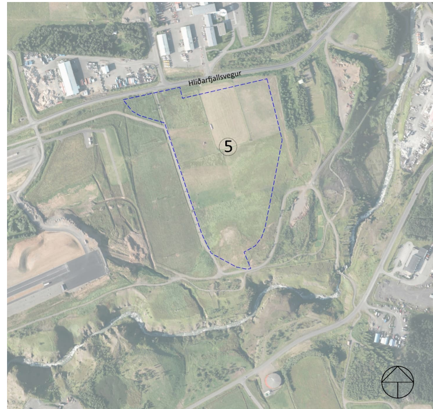
Mynd 1 Skipulagssvæðið, afmarkað með blárri brotalínu.

Auk ofangreindra lagna eru á skipulagssvæðinu fjarskiptastrengir annarra veitufyrirtækja. Aðveitulagnir að vatnsgeymi austan svæðis liggja nyrst um svæðið, þ.e. samsíða Hlíðarfjallsvegi. Þar liggur einnig aflögð kaldavatslögn.