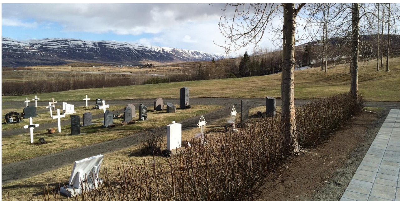
Mynd 3. Núverandi og fyrirhugað greftrunarsvæði austan bílastæða.

Núverandi greftrunarsvæði kirkjugarðsins eru að mestu sunnan Lögmannshlíðarkirkju og austan bílastæða. Einnig eru umhverfis Lögmannshlíðarkirkju ómerktar garfir frá fyrri tíð. Í deiliskipulagi er gert ráð fyrir að greftrunarsvæði garðsins þróist áfram til suður frá núverandi svæði og að fyrirkomulag greftrunarsvæða og stíga verði með sama hætti og fyrir er. Skv. deiliskipulagi er mögulegt að koma fyrir um 270 legstæðum sunnan núverandi greftrunarsvæða, í neðri garði.