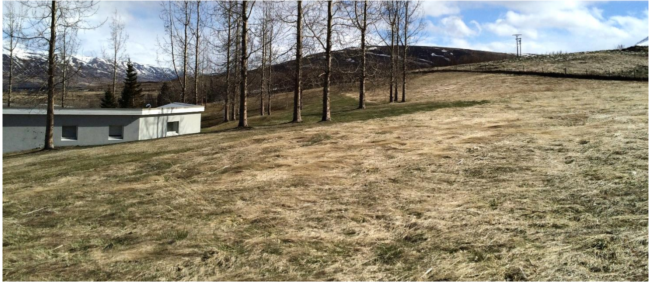
Mynd 4. Fyrirhugað greftrunarsvæði vestan við núverandi þjónustuhús.