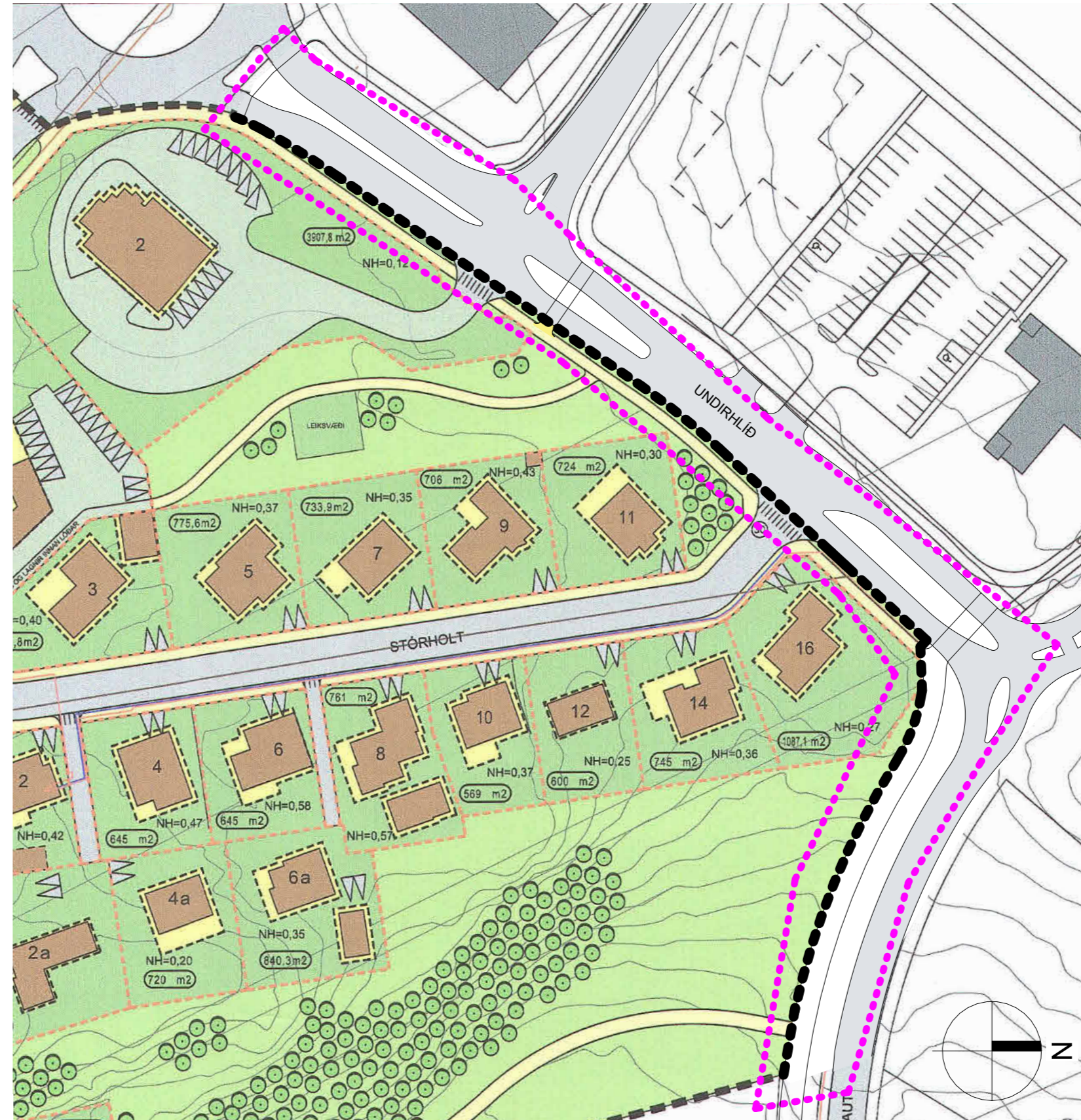
Tillaga að breytingu á deiliskipulagi 1 : 1000

Breytingar á deiliskipulaginu eru eftirfarandi: