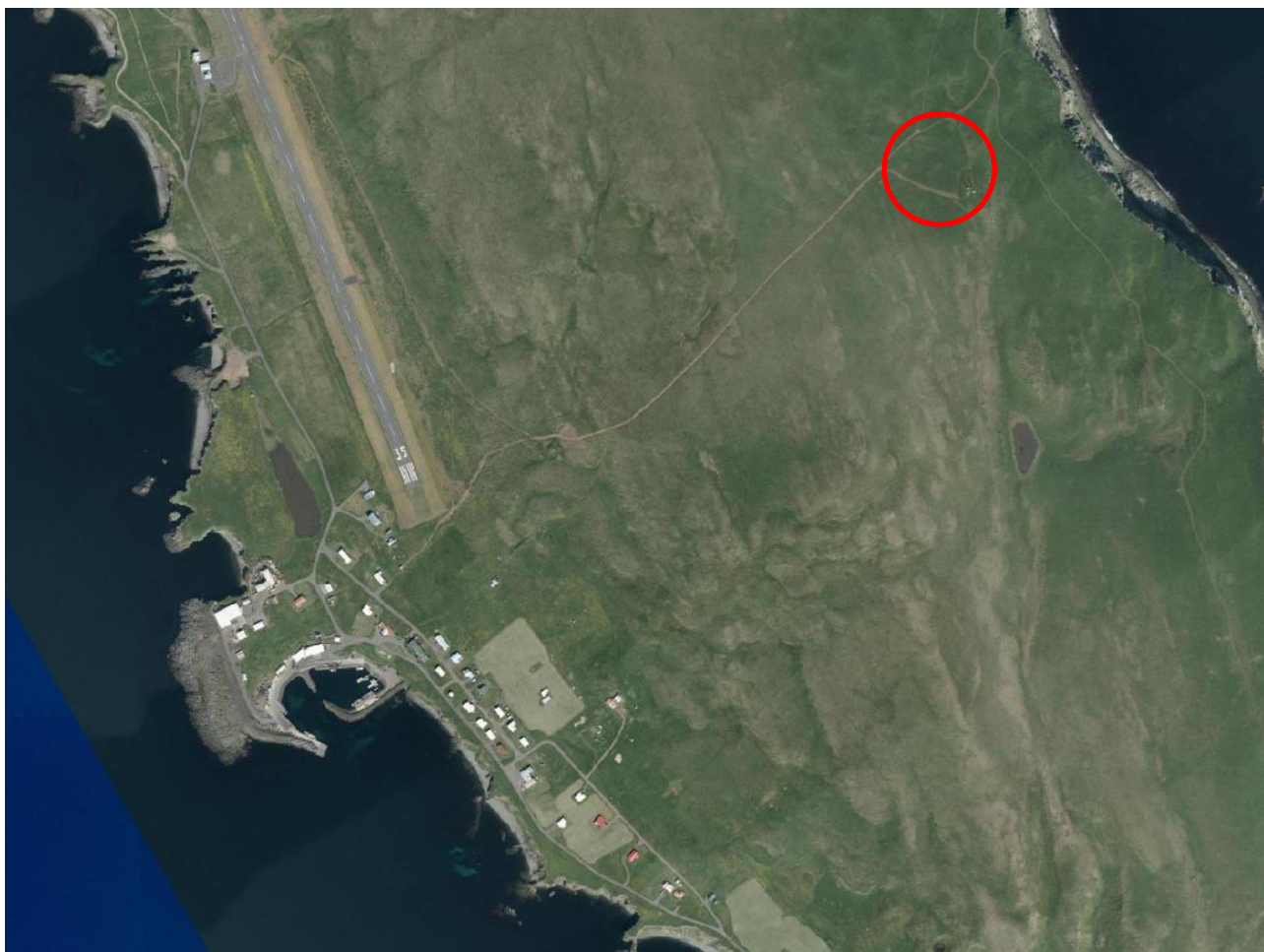
Mynd 1. Loftmynd sem sýnir staðhætti, rauður hringur sýnir afmörkun þess svæði sem breytingin nær til.

Deiliskipulagið fellur ekki undir lög nr. 105/2006 um umhverfismat áætlana þar sem deiliskipulagið mun ekki fela í sér framkvæmdir sem háðar eru mati á umhverfisáhrifum.