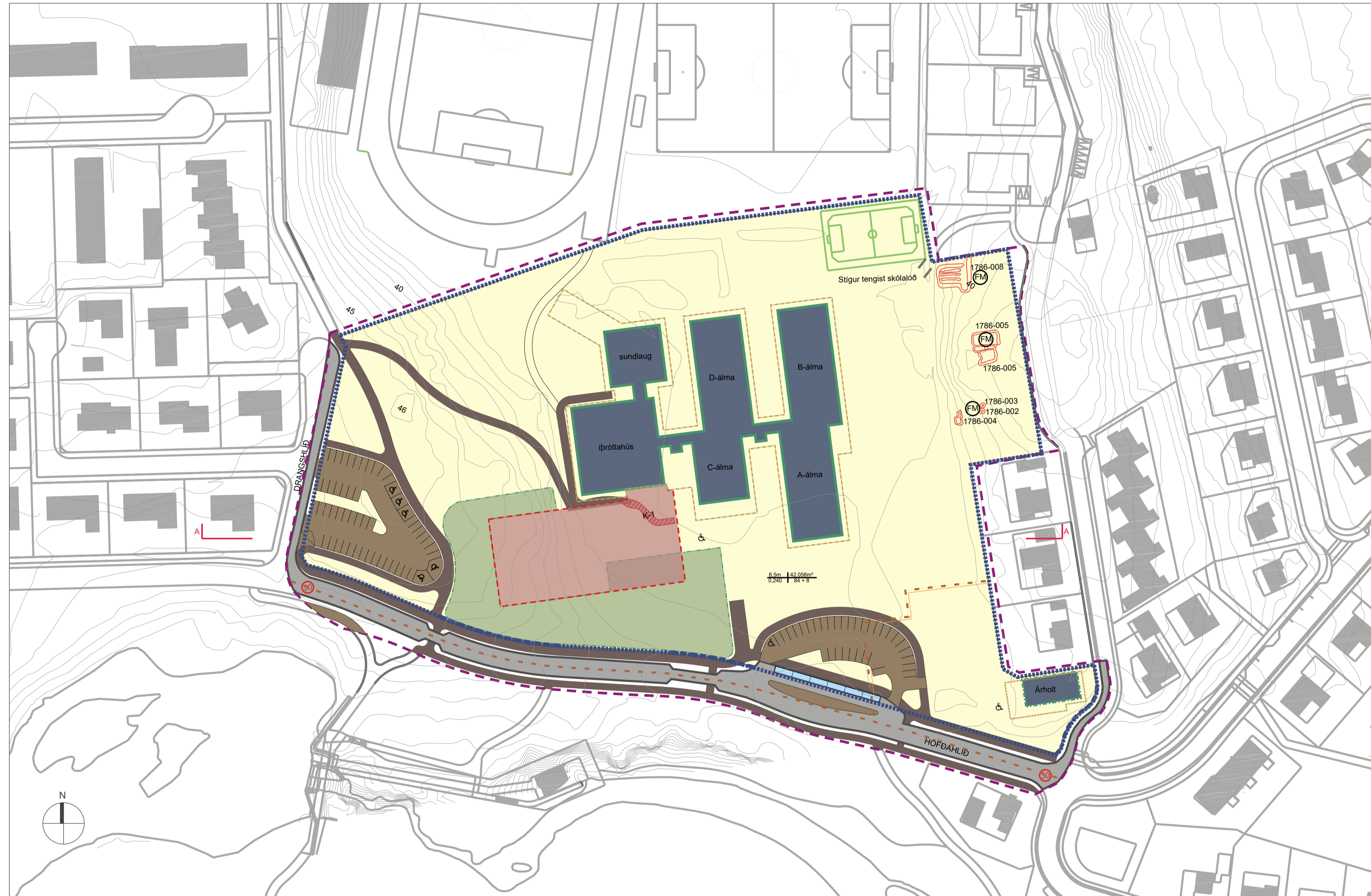
DEILISKIPULAGSUPPRÁTTUR, 1:1000 @A1