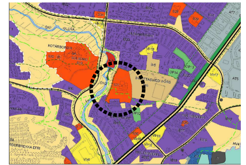
ADALSKIPULAG AKUREYRAR 2018-2030, BREYTTUR MKV. 1 : 20.000

DRÖG AÐ DEILISKIPULAGI FYRIR SKÓLA- OG ÍÞRÓTTASVÆÐIS GLERÁRSKÓLA, NÝS LEIKSKÓLA, ÍÞRÓTTAÚSS OG SUNDLAUGAR.