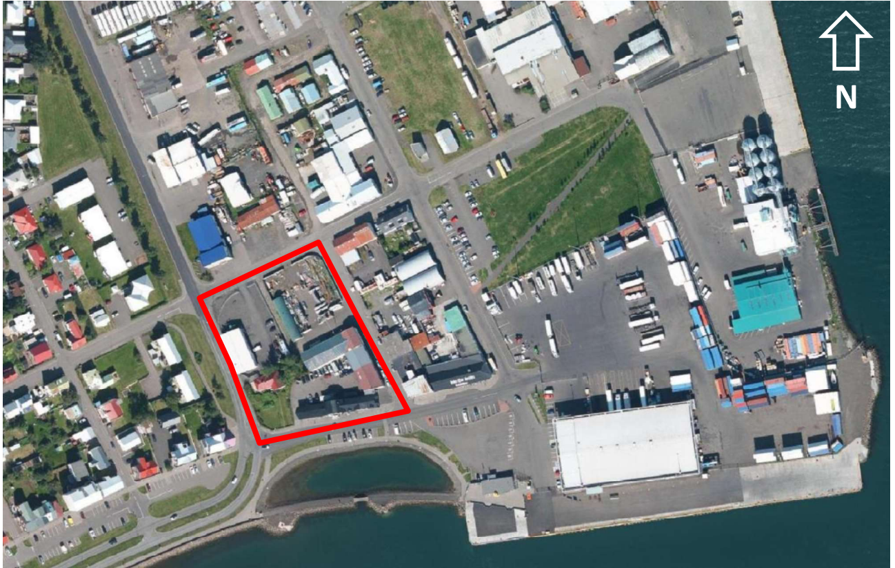
Mynd 1. Loftmynd sem sýnir staðhætti, rauð útlína sýnir afmörkun þess svæðis sem breytingin nær til.