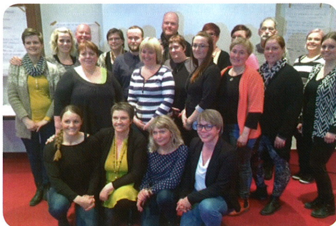
Leiðbeinendur í þjónandi leiðsögn sem luku þjálfun á Akureyri vorið 2015.

Undanfarin ár hefur hugmyndafræðin verið tekin í notkun á fleiri sviðum t.d. í vinnu með öldruðum og hafa Öldrunarheimili Akureyrar (ÖA) í samstarfi við búsetudeild, unnið að undirbúningi og innleiðingu þjónandi leiðsagnar og samþættingu með Eden-hugmyndafræðinni á ÖA. Sú vinna hófst með skipulegum hætti í ársbyrjun 2014 með þátttöku leiðandi starfsmanna í námskeiðum og ráðstefnum og nú síðast með innleiðingarferli og fræðslu til u.þ.b. 300 starfsmanna ÖA á árinu 2015 og 2016. Lykilstarfsmenn búsetudeildar hafa sinnt fræðslu og hlutverki