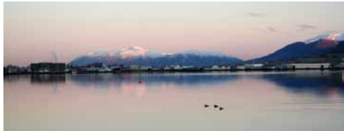
Kyrrlátur nóvemberdagur við Eyjafjörð.

Nánari upplýsingar er að finna í starfsmannahandbókinni: http://akureyri.is/starfsmannahandbok/starfsmannavefur/ og hjá starfsmannaþjónustu í síma: 460 1060.