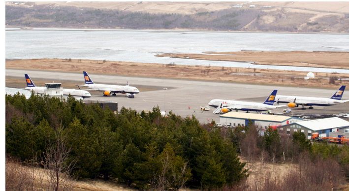
Alþjóðaflugvöllurinn á Akureyri 28. apríl 2010.

ATH! Fyrstu vikuna í maí er unnið að uppfærslu á orlofsstöðu. Vefurinn sýnir því ekki rétta stöðu fyrr en að því loknu.