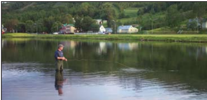
Leirutjörnin og umhverfi hennar er að breytast í litla útivistarparadís.

Sumarstarfsfólk hjá Akureyrarbæ er nú óðum að ljúka störfum. Hjá vinnuskólanum störfuðu 472 krakkar á aldrinum 14-16 ára í sumar, 82 voru í sumurvinnu 17-25 ára og 46 í sumurvinnu fatlaðra. Bæjarbúar kunna þessu fólki bestu þakkir fyrir vel unnin störf og óska því velfarnaðar í því sem það tekur sér fyrir hendur í vetur og á ókomnum árum.