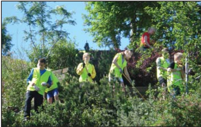
Sumarstarfsfólk að störfum.