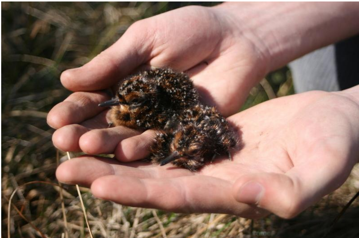
3. mynd. Nýklaktir hrossagauksungar. 07.06.09

Alls fundust 6 hreiður, þar af eitt með 3 nýklöktum ungum (3. mynd). Auk þess fannst eitt óðalsbundið þar. Við merktum 3 unga og 2 fullorðna kvenfugla með merkjum frá Náttúrufræðistofnun Íslands. Fjöldi varppara var 7.