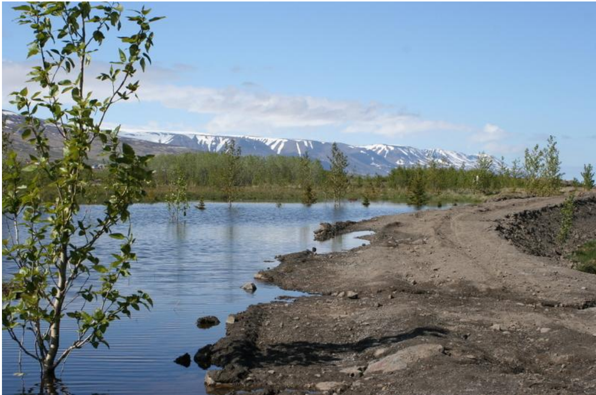
1. mynd. Nýi stíflugarðurinn í norðaustur horni Naustaflóa. Ljós. Sverrir Thorstensen 07.06.09

Mikil breyting hefur orðið á svæðinu frá 2008 eftir að stífla var gerð austast og nyrst í flóanum (1. mynd). Hundatjörn hefur stækkað verulega og einnig er mun stærri hluti flóans nú blaut mýri. Stærð talningarsvæðisins var sem fyrr 0,01 km 2 (1 ha).