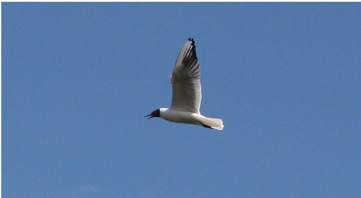
4. mynd. Hettumáfur yfir Hundatjörn í Naustaflóa. 07.06.09

Við talningu úr skýlinu sáu alls 13 hettumáfar á hreiðri en vegna þess hve gróðurinn var orðinn hávaxinn sáu ekki allir álegufuglarnir. Fuglarnir flugu allir upp þegar við nálguðumst varpið og reyndust þeir vera 35 talsins (4. mynd). Fjöldi varppara var 21.