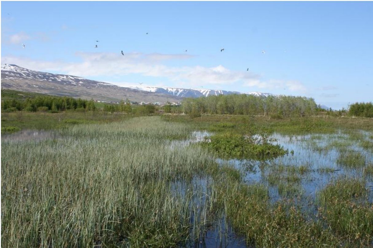
Hundatjörn í Naustaflóa. 07.06.2009

KÖNNUN GERÐ AÐ BEIÐNI UMHVERFISNEFNDAR AKUREYRAR